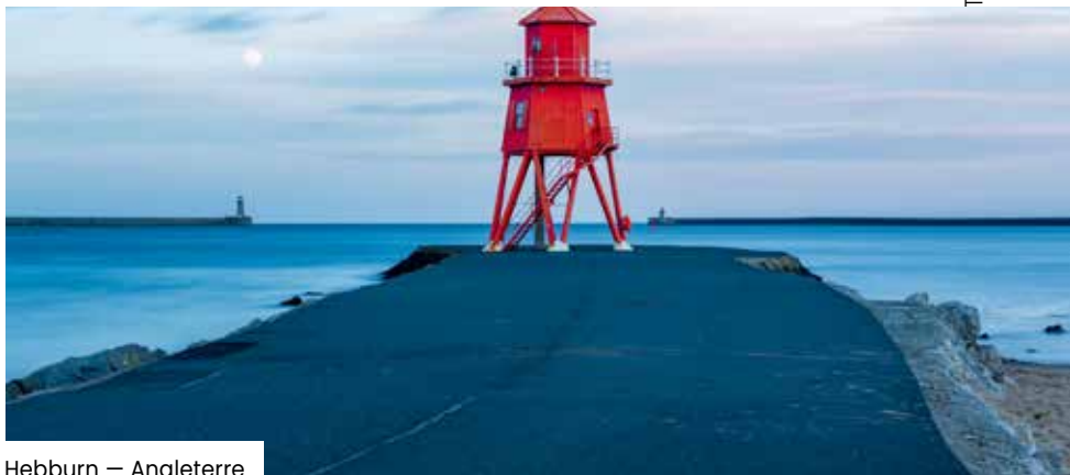
Hebburn — Angleterre