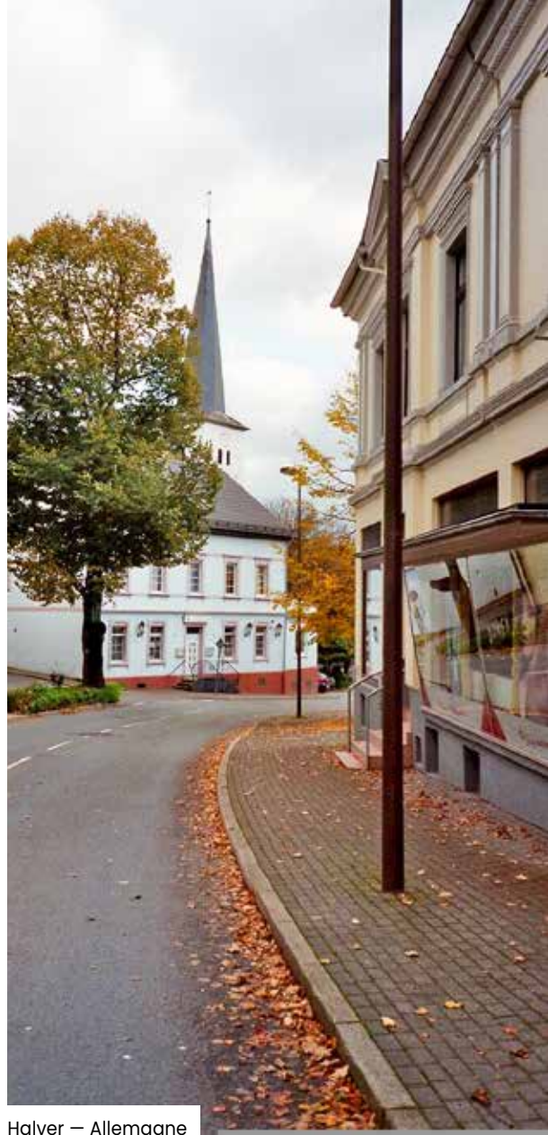
Halver — Allemagne