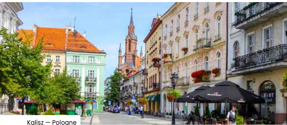
Kalisz — Pologne