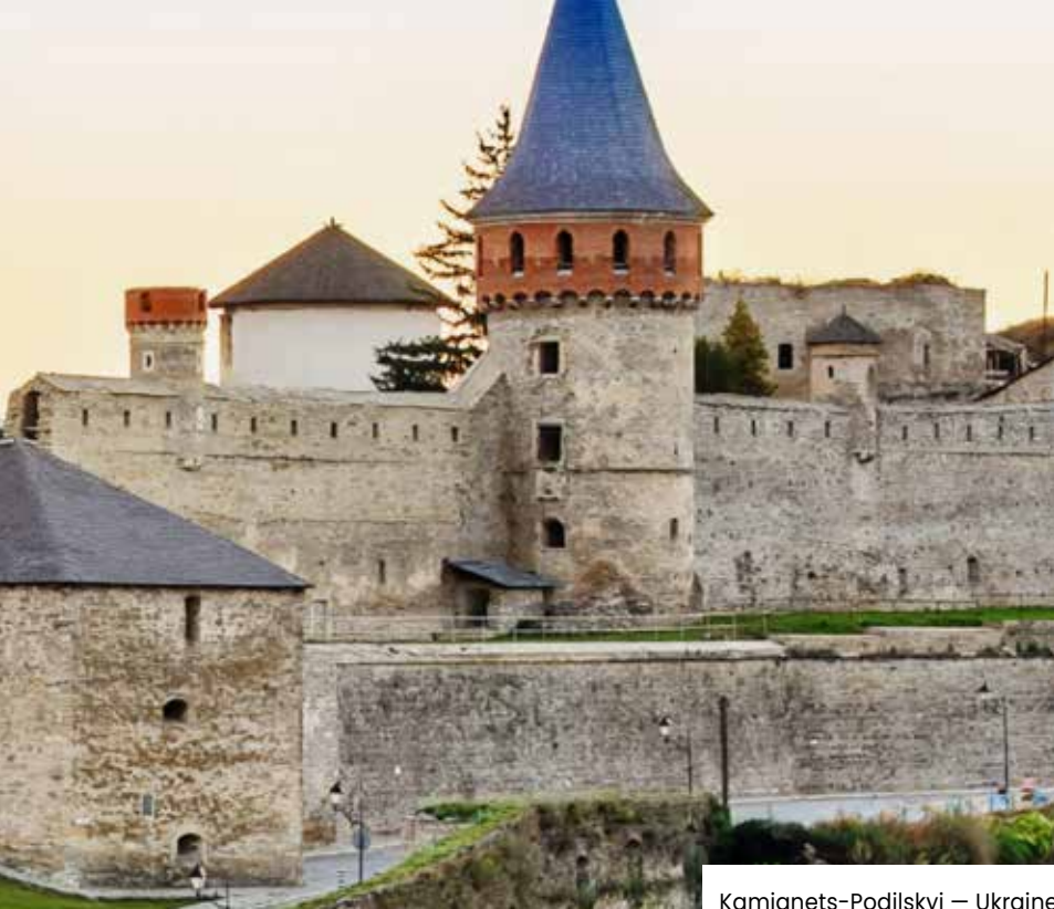
Kamianets-Podilskyi — Ukraine