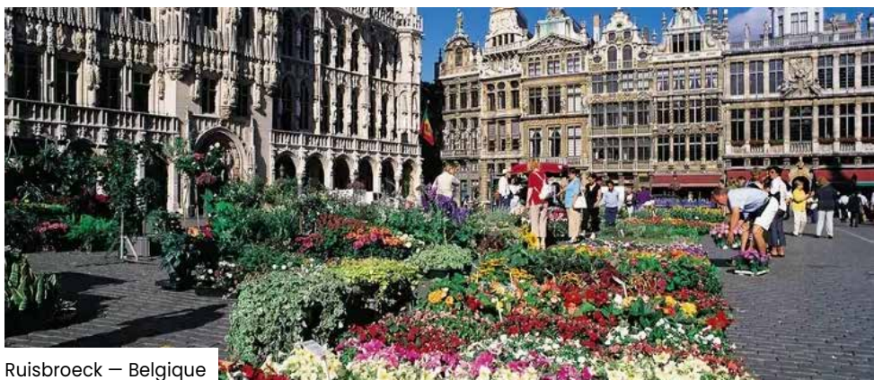
Ruisbroeck — Belgique

« Pour Kamianets-Podilskyi, le partenariat avec la ville française de Hautmont revêt une importance particulière. À l'heure où l'Ukraine lutte chaque jour pour sa liberté, nous apprécions profondément le soutien de nos amis internationaux. La signature de la Déclaration de solidarité s'inscrit dans la continuité de l'amitié entre nos communautés, née en mars 2022 avec la signature de l'accord de jumelage. Il est important pour nous d'avoir à nos côtés des partenaires qui partagent nos valeurs, soutiennent l'Ukraine et croient en notre victoire. Je remercie sincèrement la communauté de Hautmont pour son respect, sa solidarité et sa disponibilité aux côtés de Kamianets. De tels liens renforcent non seulement les villes, mais aussi les individus. »