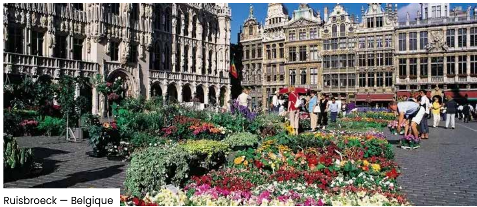
Ruisbroeck — Belgique

« Pour Kamianets-Podilskyi, le partenariat avec la ville française de Hautmont revêt une importance particulière. À l'heure où l'Ukraine lutte chaque jour pour sa liberté, nous apprécions profondément le soutien de nos amis internationaux. La signature de la Déclaration de solidarité s'inscrit dans la continuité de l'amitié entre nos communautés, née en mars 2022 avec la signature de l'accord de jumelage. Il est important pour nous d'avoir à nos côtés des partenaires qui partagent nos valeurs, soutiennent l'Ukraine et croient en notre victoire. Je remercie sincèrement la communauté de Hautmont pour son respect, sa solidarité et sa disponibilité aux côtés de Kamianets. De tels liens renforcent non seulement les villes, mais aussi les individus. »