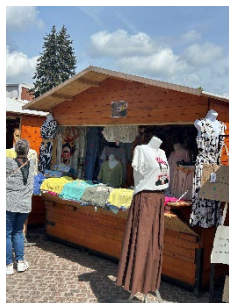
3m sans auvent avec tablette