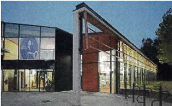
Médiathèque George Sand - Louvroil