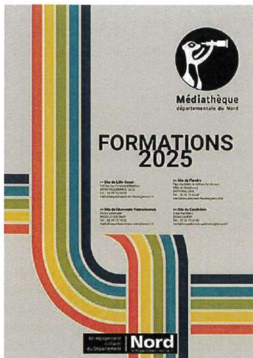
L'offre de la médiathèque départementale du Nord

La formation élémentaire proposée par la MdN donne accès à l'ensemble des clés permettant d'assurer le fonctionnement d'une bibliothèque. Elle est complétée par des formations thématiques mises en oeuvre pour accompagner l'évolution des pratiques culturelles et professionnelles.