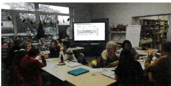
Réunion du groupe de travail réseau – décembre 2023

Leur circulation dans le cadre du système de gestion des réservations et des retours délocalisés est prise en charge par le service de coordination du Réseau.