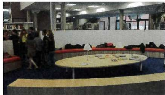
| A droite et à gauche : médiathèque d'Aulnoye Aymeries