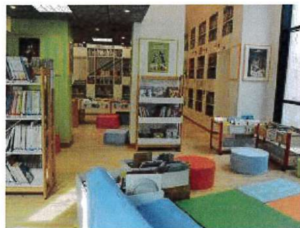
A droite et à gauche : médiathèque de Feignies