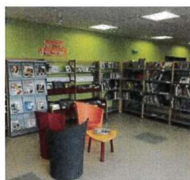
| A droite et à gauche : bibliothèque de Boussois